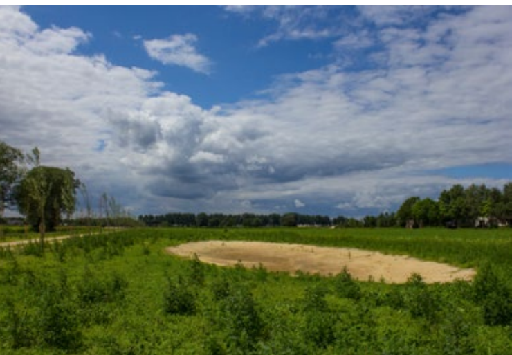
Poelen geven ruimte aan kwelwater

Volop recreatiemogelijkheden, zoveel is duidelijk. Maar bovenal wordt dit zuidelijk deel van De Groene Grens een prachtige plek voor wie houdt van wandelen (of paardrijden) in de natuur. Het is een leefgebied voor onder meer vogels, vlinders, reeën, kleine zoogdieren en amfibieën. Dankzij zogenoemde ecoduikers onder de wegen en amfibiegoten in het wegdek kunnen kleine zoogdieren en amfibieën de natuurgebieden aan de noordkant van de A12 én de Bennekomse Meent en de Hellen in het zuiden bereiken. Juist vanwege die dieren mogen honden alleen aangelijnd mee in De Groene Grens. Bij de entree aan de Dragonderweg (ten zuiden van nummer 23) is een losloopgebied ingericht waar honden, voor of na de wandeling, ook lekker los kunnen rennen.