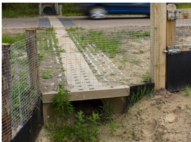
Ecoduker en amfibiegoot

Het kwelwater krijgt extra ruimte in de poelen en plassen die zijn gegraven en voorzien van natuurvriendelijke flauwe oevers. Een warm welkom voor bijvoorbeeld kikkers, padden en salamanders, voor libellen en voor veel andere inheemse diersoorten die nu