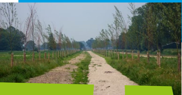
Wandel en ruiterspad

Ede en Veenendaal maken allebei deel uit van de regio Food Valley. De Gelderse gemeenten binnen Food Valley hebben met provincie Gelderland een regiocontract afgesloten voor de uitvoering van verschillende projecten binnen het onderdeel leefomgeving, waaronder de 2e fase van de aanleg van De Groene Grens. Om de budgetten van het regiocontract zo goed mogelijk te benutten en omdat het regiocontract tot eind 2015 loopt, gaat gemeente Ede het Veenendaalse deel van de kosten voor de 2e fase voorfinancieren. Op het moment dat er voldoende kavels in Balkon Zuid zijn verkocht, krijgt Ede dit geld weer terug van gemeente Veenendaal. Zo wordt een snelle ontwikkeling van het noordelijk deel van De Groene Grens in 2014/2015 toch nog mogelijk.